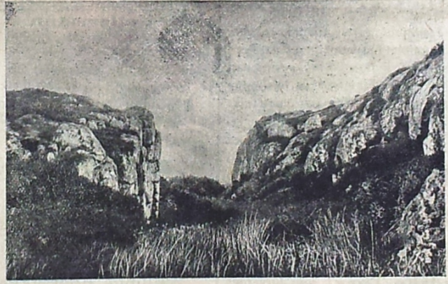
Grydedal. Fra en Udflugt i Paradisbakkerne ved Nexø.

Til disse Væv med indre Afsondring, og som har til Huse i kendte Organer, hører nu ogsaa et hidtil lidet paaagtet, som Steinach efter dets Funktioner har kaldt "Pubertetskirtlen". Stedet for dette Væv kan ikke forundres os: Allerede i det ydre Billede af Livet optræder ved Siden af Hungeren i Følge Ordspørgt Kærligheden som Livets mægtigste Regent. Til Trods herfor har den kortsynede Verden snart lovprist den, snart foragtet den, men næsten altid undladt at vurdere den rigtig. Dog, efter at mere og mere de Slør falder bort, som af Uforstand og ond Vilje er trukket over Seksualismens Indre, overrasker det ikke