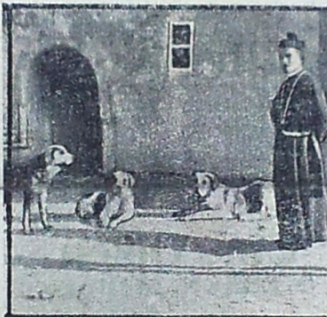
Fra Klosterets Hundegaard.

Allerede fra Midten af September er dette Pas, som fører over Alperne mellem Schweiz og Italien, dækket af dyb Sne. I det gamle Kloster, der ligger ca 8000 Fod over Havoverfladen, bor der 15 Munke, som sammen med deres trofaste Hunde, hvert Aar redder mange Menneskeliv. Over 20,000 Personer passerer hvert Aar Passet, og da de altid er udsat for at blive overfaldet af en af de mange Snestorme, maa Munkene hele Vinteren være paa deres Post og være parate til hurtig Udrykning.