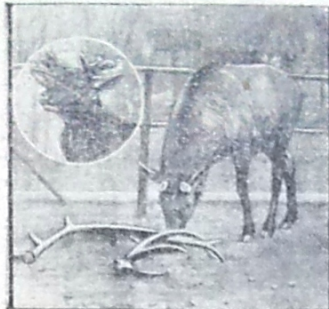
Et Elsdyr, som har mistet sine Takker I. Cirklen ses de nye at bryde frem.

Pas er baade Sommer og Vinter besøgt af mange Vejfarende. En Gang har et Uvejr endog holdt over 1000 Gæster fængslet til Klosteret i flere Dage mod det Resultat at Forraadskamrene blev aldeles udtømte.