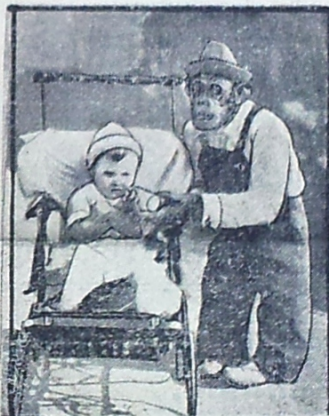
Chimpanse som Barnepige.

Som du ved maa Hjortene hvert Aar miste deres Hovedprydelse, men i Løbet af kort Tid vokser der nye Gevir frem endnu større end de gamle. Det samme gælder for Elsdyret, som du ser paa Billedet. Det er en mærkelig Naturproces, der sker her — omtrent, som naar Børn skifter Tænder. I de første seks Maaneder af deres Vækst er Gevirerne overtrukket med en fløjlsaglig Hinde, og i den Tid er de ikke anvendelige som Vaaben. Men naar Huden falder af, bliver Takkerne behaarde og løseløse.