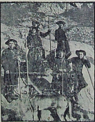
En Gruppe af de barmhjertige Munke.

Hundene trænes saaledes, at naar Munkene graver i Sneen, skal Dyrene ved Hjælp af deres Sporsans finde den eftersøgte. Saa snart han er funden begynder Hunden at gø og bliver ved dermed indtil der kommer Hjælp. Forøvrigt er de saa stærke, at de godt kan slæbe en Mand hen over Sneen. Ja, en Hund, som hedder Oliver, og som til Dato har reddet 156 Menneskeliv, bar engang et Barn 8 km. i sin Mund. Hundenes Sporsans er saa fin, at de kan finde en Rejsende, selv om han ligger begravet i Sneen; der er Eksempler paa, at de har fundet Folk, som laa begravet under 20 Fod Sne.