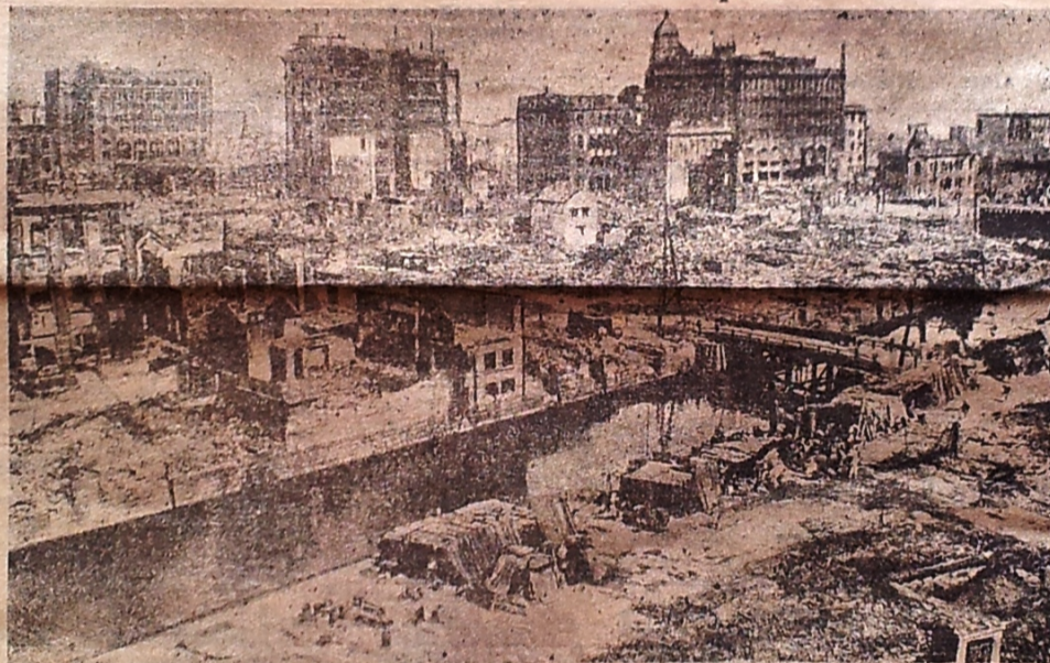
Det sidstankomne Billede fra Ødelæggelserne i Tokio

De sidste Tidens skæbnesvangre Jordskælv og Vulkanudbrud, gør atter det Spørgsmaal aktuelt, om ikke alle disse Naturbegivenheder kan have en fælles og en bestem- melig Oprindelse. At søge at af- vende eller endog blot i ringeste Grad at formilde disse Ulykker tør vel nok være fuldstændig haab- løst; men den svageste Forudan- nelse om deres sandsynlige Kom- me kunde jo faa det største Værd hvad Redning af Liv angaar. Har de moderne Undersøgelser formaat at finde nogen Slags Ledetraad der gør Forudsigelser mulige, el- antyder, at et saadant Resultat i den nærmeste Fremtid kunde op- naas? Man maa indrømme at vore Kundskaber er endnu saa smaa, at de ingen praktisk Værd har, men man er dog paa det rene med enkelte Ting, som giver Fin- gerpeg om, at det muligvis en Gang senere skulde lykkes at erhverve et mere direkte nyttigt Kendskab til dette Emne. Vi har lært en Smule om de Strøg, hvor der Indtræffer Jordskælv, samt en Smule om de Tider vi kan vente kan vente dem; og skønt denne Kundskab er svært lille, har de dog sin Betydning. Systematisk lagtagelse af Jordskælv, er ikke et halvt Hundrede Aar gammel,