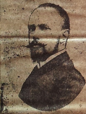
fylder 75 Aar.

Vor berømteste Illustratør, Professor Hans Tegner fylder i Dag 75 Aar. — Enhver dansk kender Hans Tegnens Illustration til Juleudgaven af Holbergs Komedier og til Verdensudgaven af H. C. Andersens Eventyr, der var et enestaaende Værk i dansk Boghandels Historie. Idet det var første Gang et dansk Forlag har kunnet udsende et Værk i Verdensudgave. Hans Tegner havde i 1899, da Verdensudgaven udkom, forlængst vundet Autoritet paa sit Kunstmaleris Raade, og havde faaet Guldmedalje i Paris, ligesom han senere fik den samme Udmærkelse i München. Allerede før Holbergsudgaven var han kendt og anset for et betydeligt, fantasirigt Talent. Med det nævnte Værk slog han sit Navn fast i Folkets Bevidsthed, og vandt den Berømmelse der kan naas indenfor et lille Lands Grænser. Men med Verdensudgaven af H. C. Andersens Eventyr indskrev han paa en sørefuld Maade sit Navn i Rækken af store verdenskendte Kunstnere. I dette Værk naaede Tegnens Kunst en Højde, som næppe er naaet af nogen anden dansk Illustratør. Den berømte Illustratør MAX KLINGER var fuld af Beundring for Tegnens Kunst, om hvilken han bl. a. skrev, at hvad der bereder mig den største Glæde, det er hverken fransk eller engelsk eller Menzelsk, endskønt der er læst, men ogsaa for-