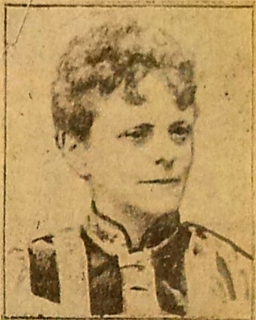
Forfatterinden Laura Kieler

fylde i Onsdags 75 Aar. Hun er født i Tromsø, men har siden 1872 været bosiddende i Danmark, og hun føler sig i hvert Fald som som særlig dansk Forfatterinde, thi det er Fædrelandssindet og Fædrelandskærligheden hun har viet sit Forfatterskab og alle sine Kræfter. Med Foredrag, Avisartikler og Bøger har hun i de sidste 30 Aar arbejdet ihærdigt for Sønderjylland; hun er Æresmedlem af „De samv. sønderjydske Foreninger“. Som Forfatterinde debuterede hun i 1869 med „Brands Døtre“, der vakte megen Opsigt; det er en Skildring af Ibsens „Brand“ efter Agnes Død. Siden har hun udsendt en lang Række Romaner og dramatiske Arbejder, hvoraf en overvejende Del henter deres Stof fra Sønderjylland, og alle bæres de af en Patriotisme saa varm og brændende, saa smuk og uselvsk, at de har Krav paa Opmærksomhed og Beundring i en Tid, hvor saa meget kun er smudsig Beregning og ussel Moral. — I 1893 repræsenterede Laura Kieler Danmark paa Verdenskongressen i Amerika for repræsentative Kvinder.