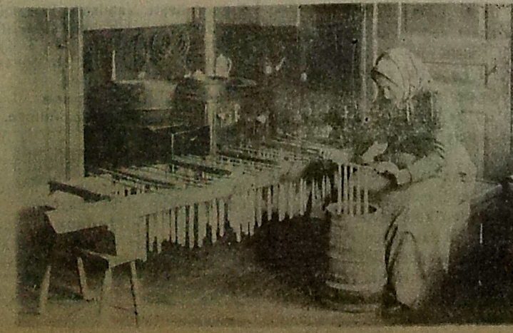
Lysstøbning i Hjemmet.

gen, og medens Kone og Pigerne kartede, spillede Karlene paa Violin og sang Viser eller fortalte Historier. Disse Sammenkomster, Kartegilder, som de kaldtes, medførte ikke blot Fællesskab i Arbejdet, men ogsaa i Aandslivet. Vel kunde Indholdet af Viser og Historier ofte være pjanket, hvadenten det nu var Historien om „Ridder Peder med Sølvøjlerne“, „Lillekurt og Kong Lawing“ eller „Sigfred og Kong Melville“, der fortælles, men Betydning havde det nu alligevel for Aandslivet i Landets afsidesliggende Egne. Det samme Liv, det samme Interiør fandt man ved Bragning og skjætning af Hør, hvorimod Lysstøbningen var noget for sig, krævede andre Forhold end dem, Folkestuen kunde byde paa. Nu, hvor det elektriske Lys snart er naaet