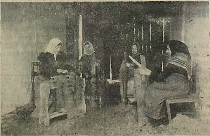
Skjætning af Hør.

De gamle Bondeskikke uddør, de gamle Indendørs-Bondesysler forsvinder ogsaa. Med Trafikmidlernes hastige Udvikling er Land og By rykket nærmere sammen, Afstandene spiller ikke mere den Rolle, som for et Par Slægtled siden, og Industriens Udvikling har gjort det af med meget af det Hjemarbejde, som Bønderne i de lange Vinteraf-tener selsatte sig med. Det kan ikke betale sig længere at tilberede Tøj selv, thi Fabrikstøjet er langt billigere. Ganske vist er det ikke saa holdbart, men det kan dog bruges. Endnu kan man dog enkelte Steder finde at nogle af vore Bedsteforældres Bondesysler holdes i Ære, men de bliver færre og færre, og det er nu kun som Tidsfordriv, de anvendes ikke for Indtægts Skyld. Vore Billeder vil maaske kunne vække Minder fra deres Ungdom, da man kartede Uld, skjættede Hør og støble Lys. Man samlede ofte en Del Koner til Hjælp ved Kartnin-