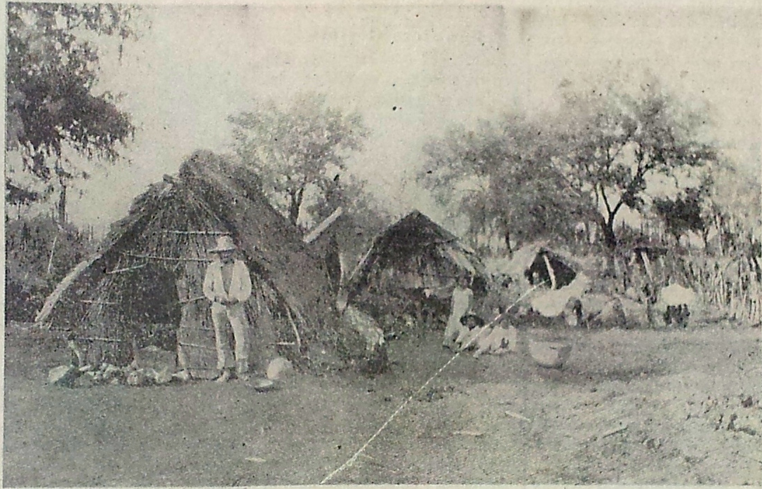
En Indianerby i Salamanca i Mexico.

De mexikanske Indianeres Boliger er i Almindelighed højst tarvelige. De opfører deres elendige Hytter af Ler eller bruger allehaande Affald dertil, f. Eks. kasse-rede Jernbaand, gamle Tøndestaver, Sukkerrør eller slidte Kokosmaatter. Tidt bestaar Boligen kun af nogle Kæppe, paa hvilke der er hængt et eller andet Tæppe —