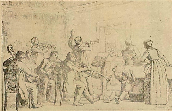
En Fanfare ved et Bondebryllup.

Paa Mandag er det 100 Aar siden at vor ypperlige, i 1920 af- døde Genremaler JULIUS EXNER blev født.