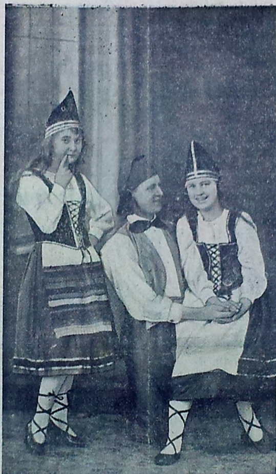
En Tur i Vingakordansen.

„Nordbornholms Ugeblad“ har altid elskværdigt stillet sine Spalter til Raadighed for Smaaartikler om Folkedanse, og Redaktøren har flere Gange trykket Programmer til Folkedanse-Opvisninger gratis. Dette var navnlig Tilfældet, saalænge der gaves Opvisninger til Fordel for Teknisk Skole. At dette i høj Grad bidrog til at give et gunstigt økonomisk Resultat er klart.