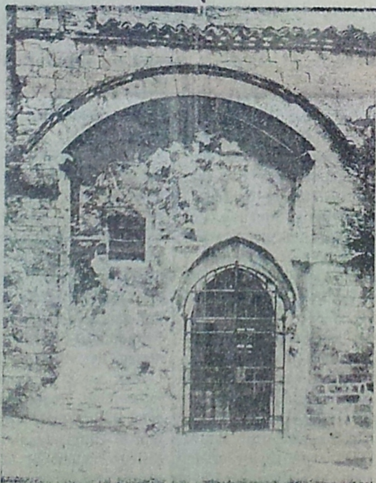
Stedet, hvor den hellige Mand fødtes, og som nu er Maal for Pilgrimmenes Rejse til Assisi.

Den hellige Frants af Assisi blev kun 44 Aar gammel.