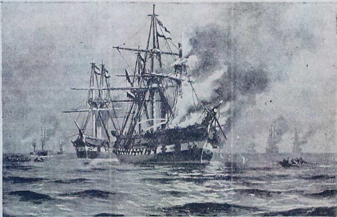
Det østrigske Lineskib „Schwarzenberg“ skydes i Brand og søger Nødhavn.