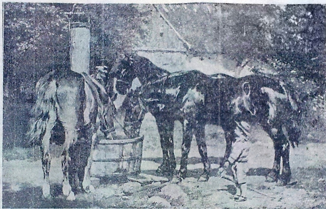
Maleri af OTTO BACHE.