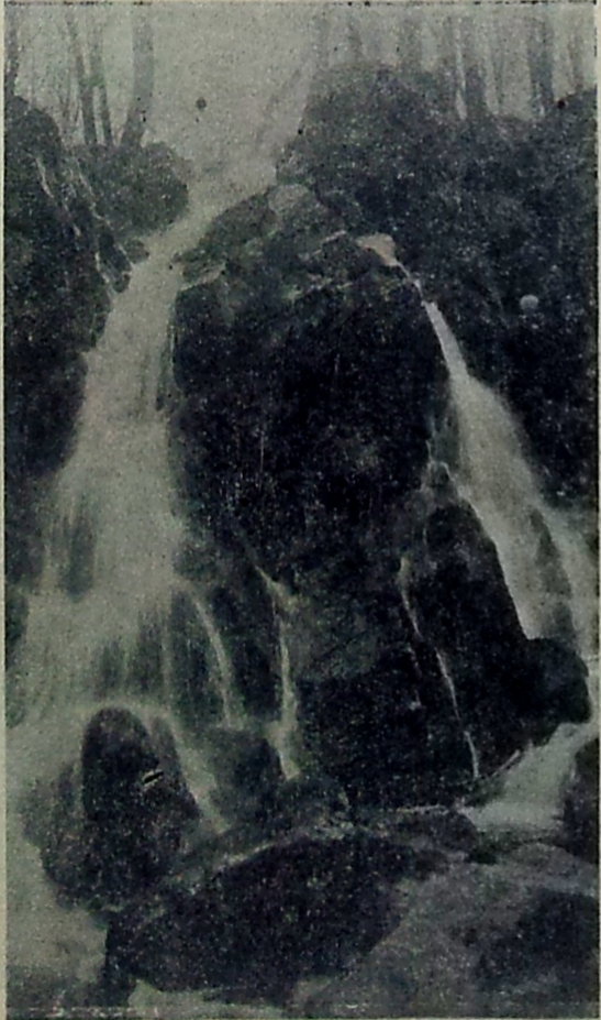
Vandfaldet i Dynddalen.

Til højre drejer en Vej op til Rutsker Plantage med mange Ud- sigtspunkter, Tudehøj og Stenrø- ret. Til venstre kan man følge Spellingeaaen lige til Rø Plantage, men Kleven er saa afvekslende, at den binder os, og inden vi ved af det er vi ved Splitsgaard. Til- bage ad Landevejen til Lyngholt,