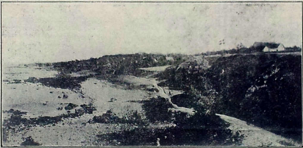
Udsigt over Kaasen og Stammershalde.

Ad den maleriske Strandvej forbi Jydeskæret naar vi Troldskov- en, der hører til Kurhotellet „Stammershalde“, og denne er nok et Besøg værd — paa en Gang vildt forreven og smilende idyllisk. Gigantiske Klippeblokke ligger her over hinanden i sære Formationer, Minder fra Istiden, et Sted dannende en Talerstol, et andet Sted en Klippegrav efter bedste oldnordiske Mønster. Gam- le Træer, omspændt af Vebend, staar som Kæmper Vagt for Hel- ligheddommen. Hele Skoven er et Virvar af Floras Rigdom, mægtige gamle Ege, knudrede Avnbøge, ranke Aske, Birke og Graner, vilde Kirsebær, Alm, Dværgahorn, Fyr og Rønnebærtræer er blandet med hundredaarig Tjørn, cypresagtige Enebærbuske og tætte Hasselgrup- per. Skovbunden er dækket af et Blomsterflor uden Lige, et Eldora- do for en Botaniker. Mange sjældne