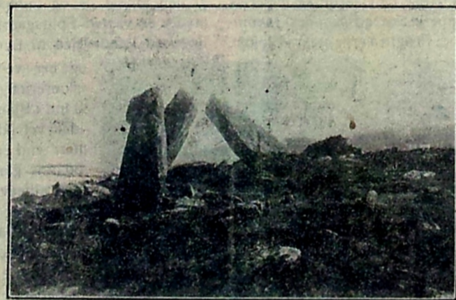
Bøvetastene ved Stammershalde.