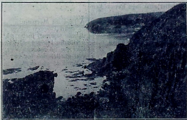
Parti fra Hammeren.