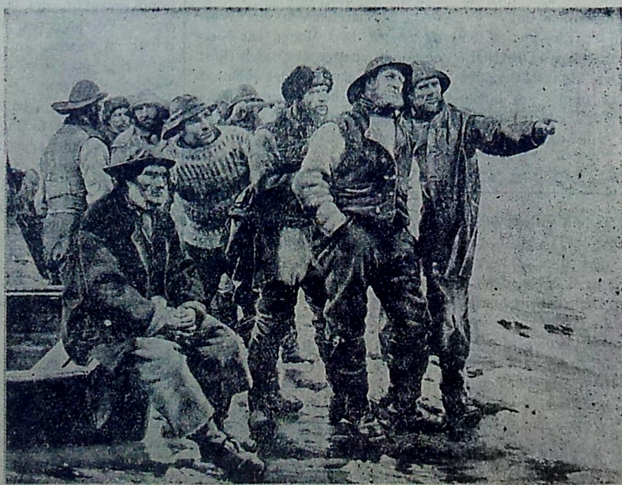
Michael Ancher: Vil han klare Pynten?

Af de gode Feer ved min Vugge har Feen med Grødfadet nok væ- ret tilstede og undertiden husket mig; Feen, der vogter Smørhullet, kun sjældent. En usselig Hytte paa Skagen og en gammel Villa i København er, hvad de har skænket mig. —