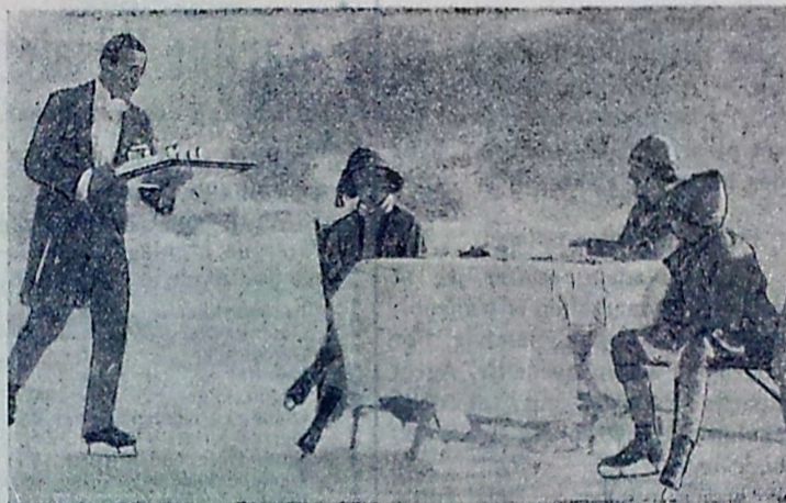
Koldt Bord med en lille, varm Ret.

Schweitz's Vinterkursteder har nu sin Højsæson. og Turister fra hele Verden munter sig paa Skøjter og Ski i den pragtfulde Natur, hvor Sne og Is har givet alle Konturer en eventyrlig Renhed og Skønhed. — Ovenfor ser man et lille Sportselskab, der indtager et i dobbelt Forstand koldt Bord med en lille varm Ret paa en af de til Grand Hotel Rink i St. Moritz hørende Isbaner. Man vil lægge Mærke til, at det ikke alene er Sportselskabet, der er paa Skøjter, men ogsaa Tjeneren glider frem paa Skøjter med Servicet. — Befolkningen i St. Moritz er jo saa godt som født med Skøjter paa Benene.