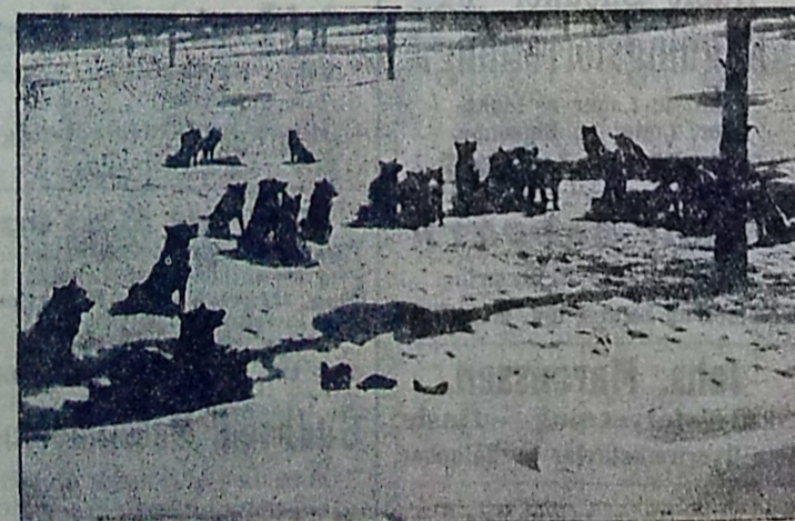
Ulve hylér ad Maanen paa Sibiriens Stepper.

De store Isbjerge, der fra Nordpolaregnene sejler ned mod de sydligere Egne, er ofte til stor Fare for Skibsfarten. — Her er Skibet sunket efter et Sammenstød, og Mandskabet, eller en Del af det, har reddet sig op paa selve Isbjergtet. Det skete ved Nattetid og i Taage, hvor selv en aarvaagen Udkigsmænd ikke kan se den store, hvidlige Iskolos, før det er for sent at varsko. — Heldigvis blev deres Nødflag observeret næste Dag af et forbisejende Skib, der reddede de skibbrudne fra den visse Død.