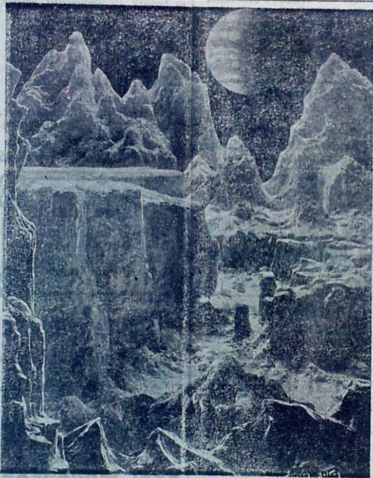
En Tegning af et Maanelandskab med vor Klode, Jorden, svævende i Baggrunden.

Nu slutter vi Rejsen. Lad os slutte den paa Sirius, den smukkeste Stjerne paa vor Himmel. — Den svæver 92 Trillioner km. fra Jorden. Og lad os fra Sirius se