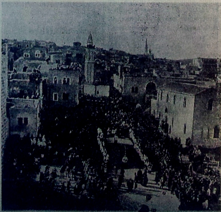
Processioner i Bethlehem.