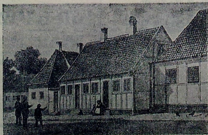
H. C. Andersens Barndomshjem i Munkemøllestræde.

De Stemninger og Følelser, som kommer op i Menneskene i Julemaaned, er netop de samme som besjælede vor kære, gamle Eventyrdigter H. C. Andersen. Han og Julen og Eventyret hører sammen. Som hans Liv formede sig, formede han sine Eventyr ud fra de mest dagligdags Begivenheder, og forstod at udlede Moralen. Hans Eventyr er den bedste Julegave til det danske Folk, ja til al Verden. Ingen har mere end ham haft Indflydelse paa de opvoksende Generationer. 125 Aars Dagen for hans Fødsel næste Aar vil derfor blive fejret — ikke alene i hans Fødeby, Odense, hvor der gøres store Forberedelser, men over hele Verden.