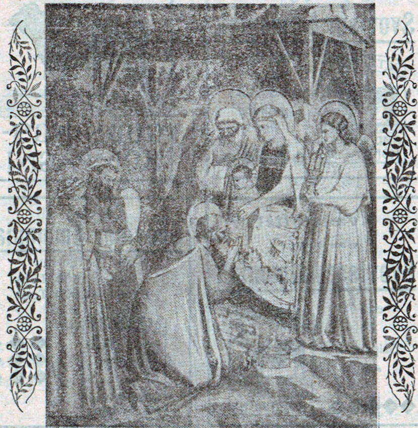
De hellige tre Konger.

om, hvorvidt de snart skulde holde Bryllup eller ej. — Det skete paa mange mærkelige Maader. Hvis en ung Pige gerne vilde vide, i hvilke Egne af Landet hendes tilkommende Brudgom boede, saa skulde hun ved Midnatstid gaa i Haven, ryste et Frugttræ og fremsige en Trylleformular. Derefter stirrede hun forventningsfuld ud i Mørket, og naar hun i det Fjerne hørte en Hund gø, betragtede hun det som et Varsel om, at fra den Egn af Landet vilde Frieren en skønne Dag komme rejsende til hende.