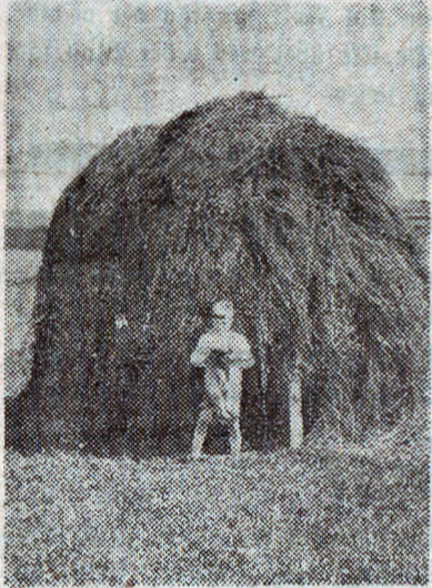
En Stakrytter, den ideelle Høbjergningsmetode, især naar det drejer sig om en kløverrig Græsblanding. Billedet er fra Sydsvællands Landbrugsskole.

Danmarks Import af Foderstoffer er tvedelt, ogsaa med Hensyn til Formalet. Importen af Korn (væsentligst Majs), der kostede over 150 Mill. Kroner i 1931, er Udtryk for, at vi avler for lidt til den Husdyrbrugsproduktion, vi har stillet paa Benene. Naar nu Eksporten (Flæsk) skal beskæres, vil denne Del af Foderstofimporten formindskes af sig selv. Importen af ca. 720 Mill. kg æggehvideholdigt Kraftfoder i 1931 til en Værdi af 87 Mill. Kr. er derimod Udtryk for, at vi ikke i tilstrækkeligt Omfang selv kan frembringe det specielle Foder, som en højtudviklet Smørproduktion kræver. Men det synes jo, som vi heller ikke i den kommende Tid vil kunne afsætte saa stor en Smørmængde, som den nutidige Produktion er indstillet paa, og derfor maa Kraftfoderimporten ogsaa bringes ned. Men for at ikke Forholdet mellem æggehviderigt og forholdsvis æggehvidefattigt Foder skal forskydes fra det, som Smørproduktionen kræver, maa og skal vi ind paa Frembringelse af mere æggehviderigt Foder her i Landet.