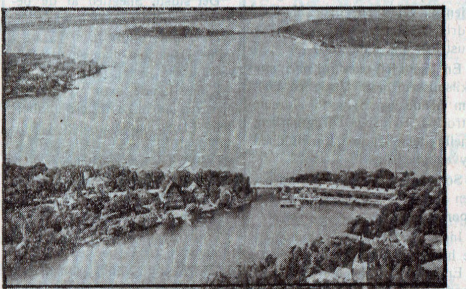
Wannsee i Fugleperspektiv. Berlins populære Badestrand.