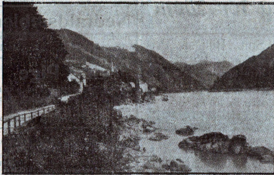
Sct. NICOLAJ mellem Linz og Wien