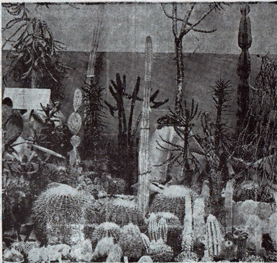
En Række smukke og sjældne Kaktusplanter.

Han saa paa et Regnskab. „Tre hundrede to og tredive Francs.“