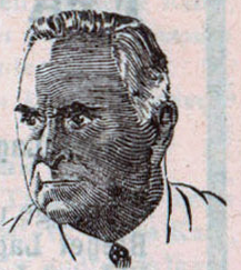
Olaf Fønss i Rollen som alvorfuld Videnskabsmand