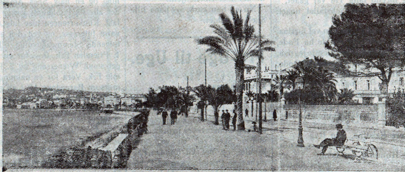
Den flotte Promenade i Cannes ved det blaa Middelhav