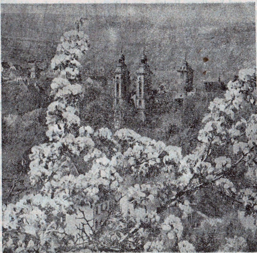
Sommer i Tyrol

Lawrence af Arabien er gaet bort, 46 Aar gammel. Hans Liv var et Drama, og hans Død svarede dertil. Den Mand, der engang blev kaldt Arabiens ukro-nede Konge, førte i de senere Aar en Eneboers Tilværelse; for nogen Tid siden kvæstedes han ved en Motorulykke paa Landevejen, og udaandede paa et lille engelsk Militærlazaret. Mystik omgav ham til det sidste. Efter at have naaet Verdensrytrak han sig pludseligt tilbage og blev først under Navnet Ross