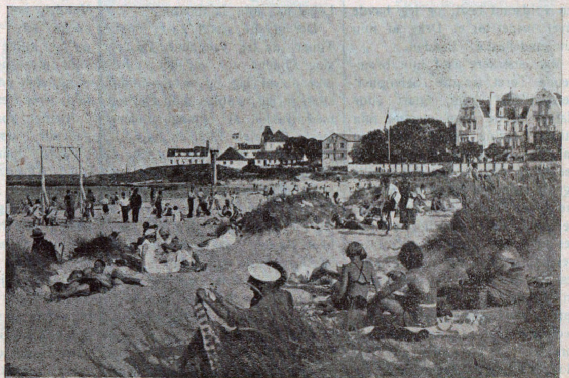
Sandvig Strandbad og Promenade er ogsaa i Aar bleven moderniseret