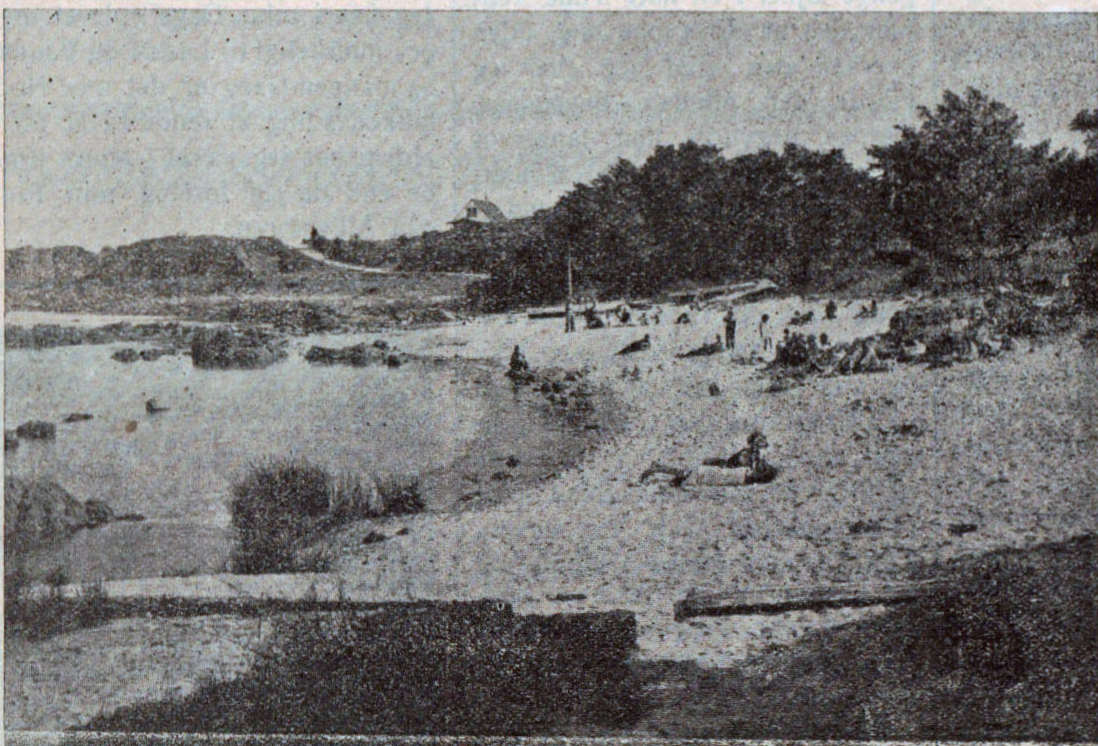
Allinge Badestrand, som i Aar er bleven betydeligt forbedret.