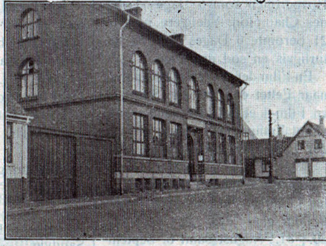
To kendte Gadebilleder fra Allinge: Kirkegade og Kommuneskolen.