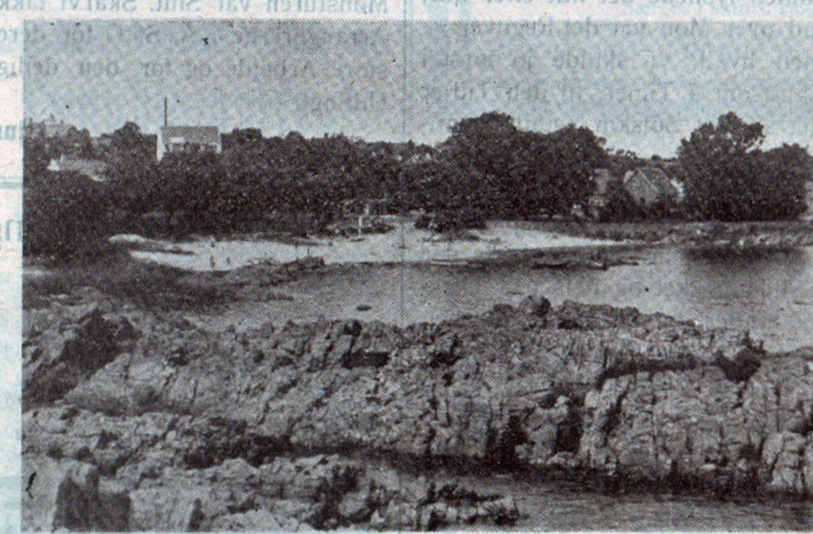
Allinge Badestrand har i Aar været godt besøgt