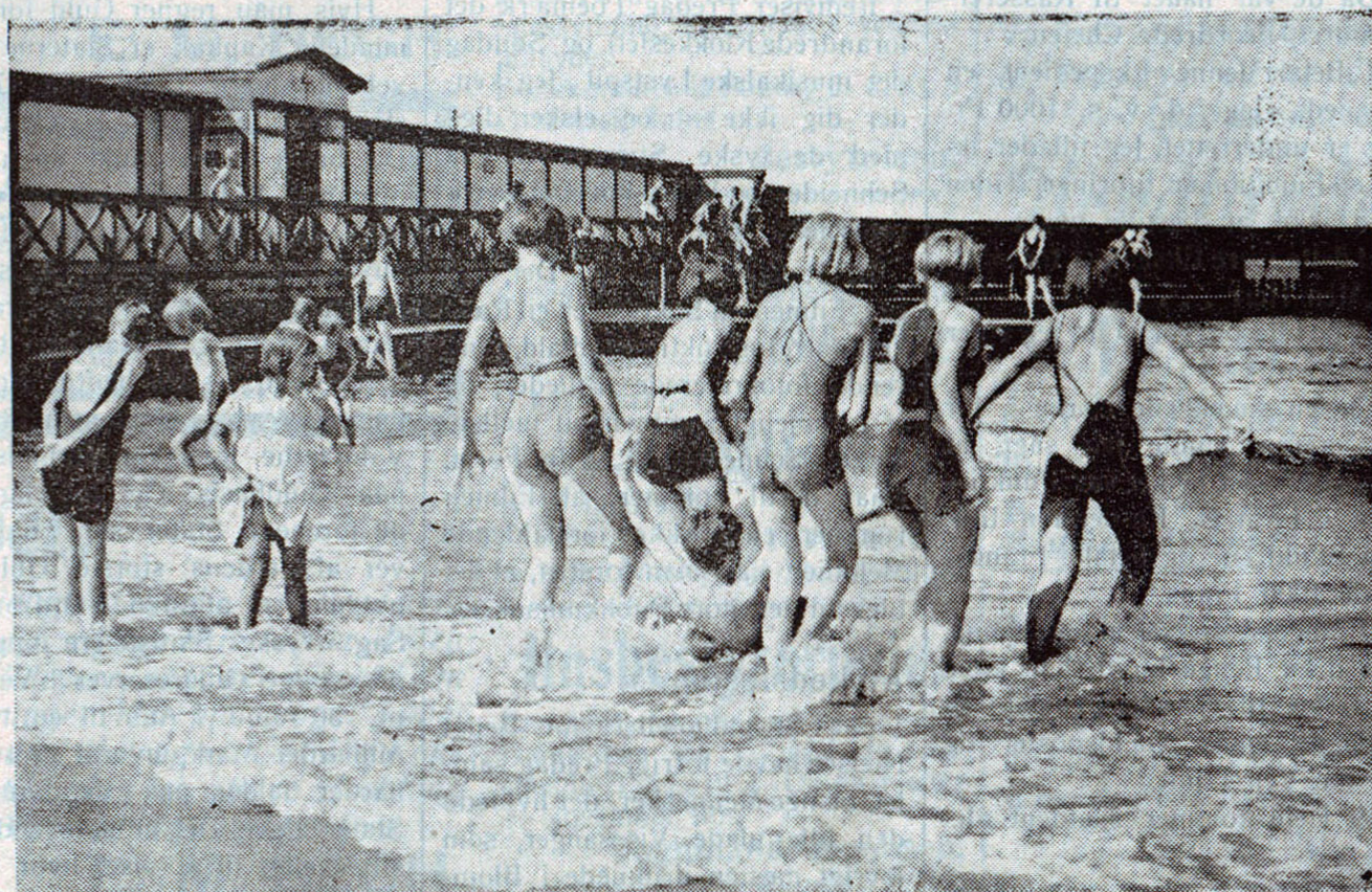
Scene fra Sommerens glade Badeliv - Børnene morer sig.

— Det er en Tyv, tror jeg, hviskede Richard. Han huskede, hvad Moderen havde sagt ham, at han skulde trykke paa Knappen til det elektriske Ringeapparat, hvis der var noget i Vejen, saa vilde Pigen komme.