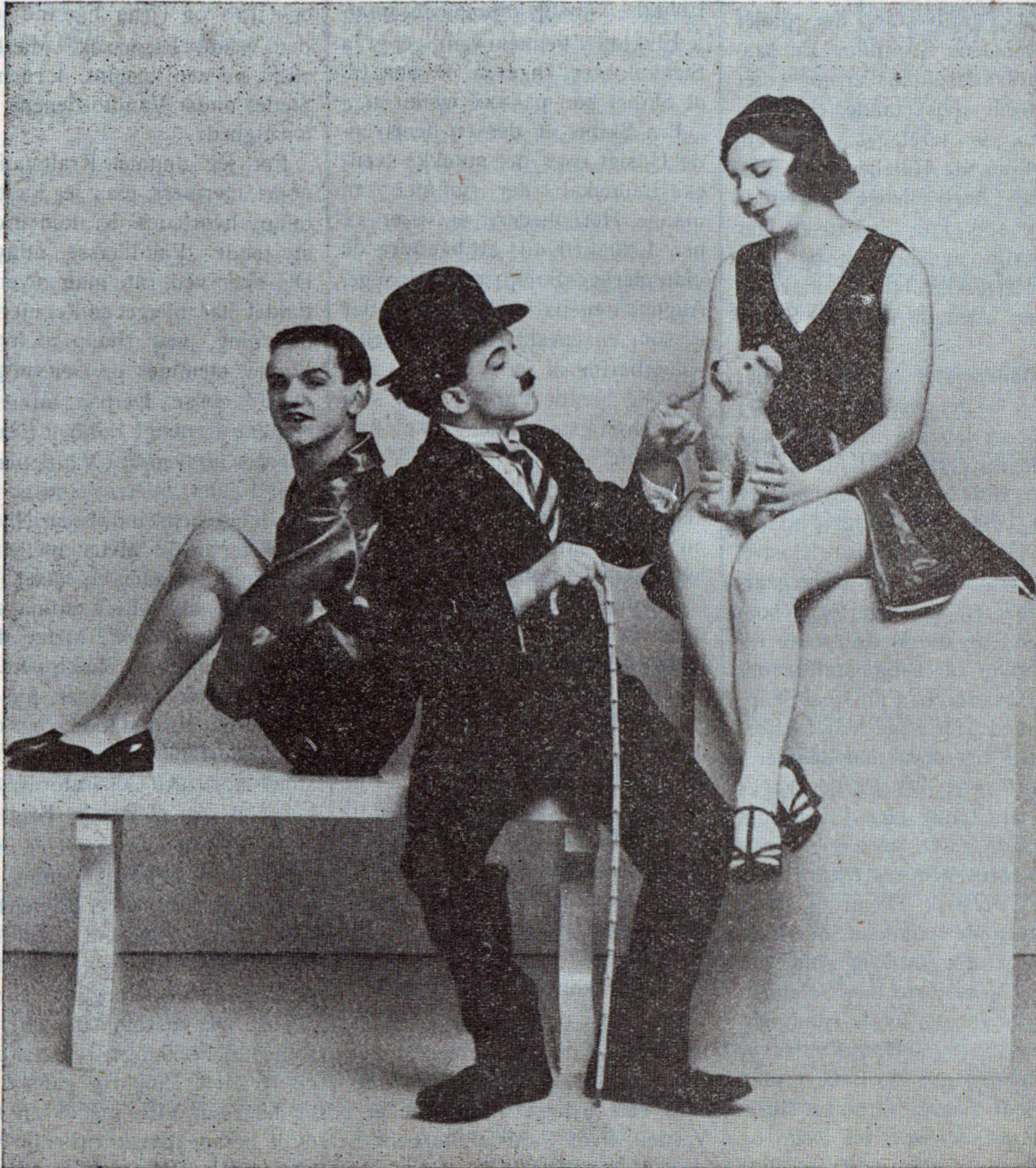
Det er ikke et Scenebillede fra Chaplins sidste Film — det er „The Solos“, Palmehavens sidste Attraktion.

Juniorholdet er nu rykket op i den fine Række nemlig Junior A Rækken og spillede i Søndags imod R B I jun. og tabte her 1—4. I forrige Turnering vandt de alle deres Kampe, men det kniber nok mere nu de kommer op mod de stærke Hold. Naa, vi haaber det bedste, der er i al Fald Krudt i de smaa Juniorer. A. S. G.