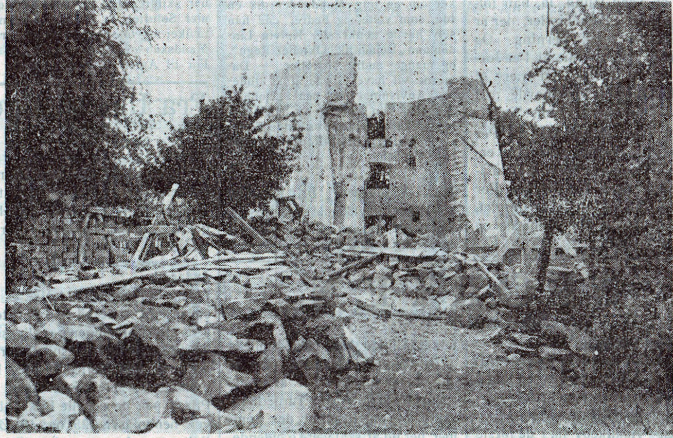
Dybbøl Mølle genrejses.

gedede med en tragisk Mine paa Kakkelovnen, fra hvilken en Mængde Sod og Røg væltede ud i Værelset. "Ja, ser Herren," sagde Manden undskyldende, "saadan har vi det altid, naar Vinden blæser fra den Kant." Nevill gik ud i Vestibulen. "Er der Brev til mig?" spurgte han for tiende Gang paa samme Dag. "Ja, her er et til Herren," sagde Portieren og rakte ham et Brev, som viste sig at være en Regning. Det havde lysnet lidt i Nevills Ansigt, men nu blev det saa uendelig langt igen. "Hvor er Salonen?" spurgte han tvært. "Jeg er nødt til at forlade Læseværelset for den forødmte Kakkelovns Skyld, som ikke gør andet end ryger." "Ja, Herren forstaar, naar Vinden kommer fra den Kant, saa—" "Ja, jeg ved det," næsten skreg han, fortvivlet over at høre den Frase gentaget. Table d'hôte sammen med en gammel gnaven Frue, som sjældent aabnede sin Mund, uden naar hun vilde sige en Ubehagelighed. Hans Tanker førtes uvilkaarligt til den hyggelige Spisestue derhjemme, hvor den paapasselige Schov altid var parat, men fremfor alt tænkte han paa det lille, smukke Ansigt, som han var vant til at se rettet leende mod sig fra den anden Ende af Bordet, midt imellem en Mængde smukke Blomster. Saa slog han sig ned i Salonen. Ved Vinduet sad den gamle, gnavne Frue med et stort Strikketøj i Haanden. Nøglet var rullet ned paa Gulvet, han tog det høfligt op og rakte hende det. Hun gjorde en stiv Bøjning med Hovedet og hvædede: "Takker". Han søgte at indlede en Kon-