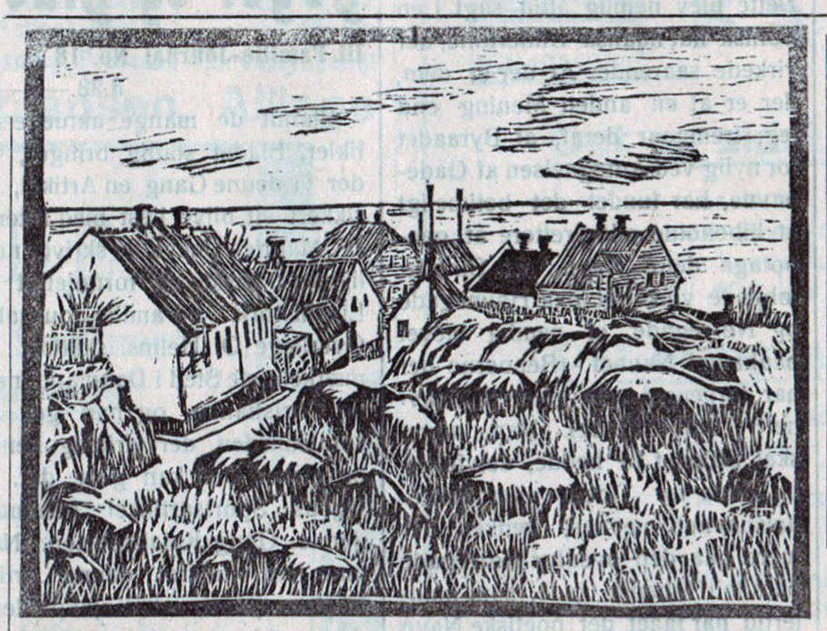
Linoleumssnit af Svend Aage Arvidsen

At England har begyndt en selvstændig Roesukkerfabrikation, vil i høj Grad forøgede Vanskelighederne for Roesukkerindustrien i