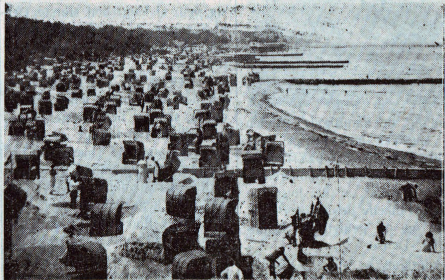
Badestrand med Strandkurve. Bemærk Høfderne, der fastholder Sandet

promenaden med de store Træer, de hvide Restaurationsborde og Bænke, Koncertribunen, Badeanstalten, gamle, kendte Steder passerer, kun en enkelt Bil og Bølgernes Kluk langs Stranden afbryder Nattens Stilhed. Saa kommer den nye Dag, langsomt viger Mørket, hvide Kridtklinter, hvide Hotelpaladser titter frem bag grønne Træer, og det er næsten lyst da vi entrer Jernbanen og ruller ud over Rügens frodige Landskab. Det tyske Banemateriel er nu iudmærket Orden; der spares ikke mere saa meget paa Smøreolien, Hjulene glider let hen over Skinnerne, men der bruges endnu mange gamle 3. Kls. Vogne med