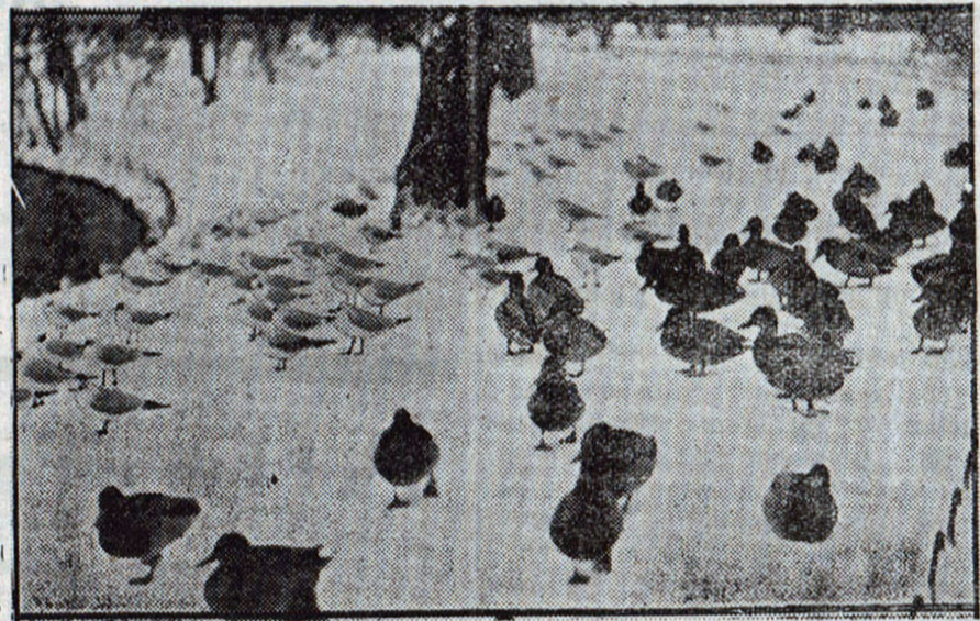
Naar Vinteren stænger.

Men hun havde foresat sig at spille en Rolle, som hun aldrig havde spillet før, og hun udførte