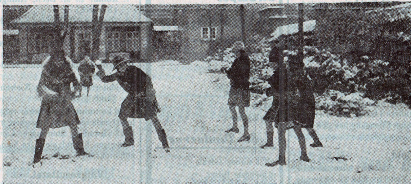
Vinterens sidste Sne. Ungdommen morer sig.

Vigtige Handeler indgaaes hyppigt skriftligt: en Handlende sender en Skrivelse til en anden, hvori han tilbyder at levere en vis Ting. Hvornaar er den Handlende nu bunden ved sit Tilbud? Det er han, saa snart Tilbudet er kommet til den andens Kundskab, altsaa i Reglen saa snart den anden har modtaget Skrivelsen. Naar en Mand, der har afsendt en saadan Skrivelse, fortryder det deri gjorte Tilbud, kan han altsaa tage Tilbudet tilbage, hvis det endnu ikke er naaet til sit Bestemmessted. I denne Sammenhæng kan det noteres, at Postvæsenet er forpligtet til at udlevere Afsenderen et Brev, som endnu ikke er kommet Adressaten i Hænde. Selv om Skrivelsen imidlertid ikke kan kaldes tilbage, vil det være tilstrækkeligt, naar Manden paa en eller anden Maade (f. Eks. pr. Telegram) giver den anden Meddelelse om, at det i Skrivelsen gjorte Tilbud ikke skal gælde — naar saadan Meddelelse er den anden i Hænde