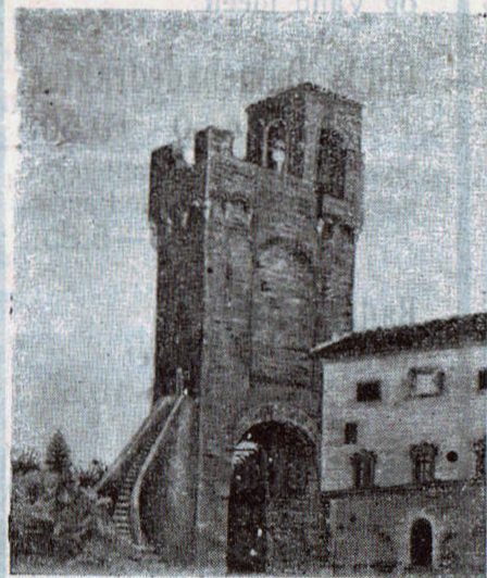
Gammel Søroverborg ved Ombrone.

Grosseto ligger ved Ombronefloden og er en meget gammel, malerisk By med interessante Taarne, hvortil stejle, spiralformede Trapper udvendig paa Muren fører op til de øverste Etager. Her er ogsaa flere smukke offentlige Bygninger og Kirker, saaledes Cathedralen, opført af flerfarvet Marmor.