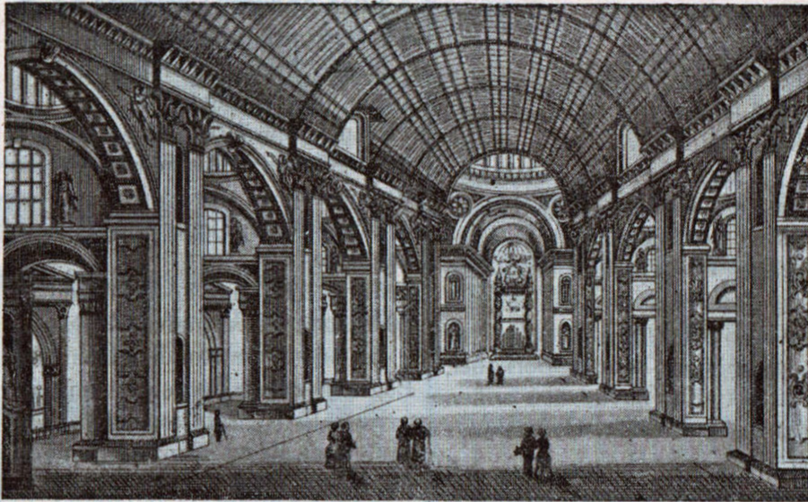
Interiør fra Peterskirken.

De nye Signaler er hejst, og under den nuværende Kri- ses Jordskælv vil Fremtidens bloddrypende Statsform blive født.