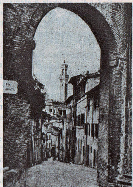
En af Sienas gamle Byporte.

Han gav dem Okser, Kvæg og Æsler for at gøre dem til Bønder, men de fortærede Okserne og Kvæget og spredtes derefter som Ulve og Hunde rundt om i Verden.