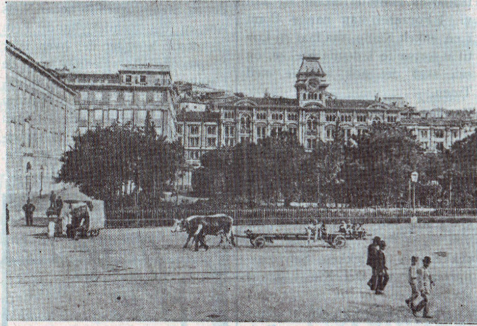
Rådhuspladsen i Triest.

„Der er ingen hjemme der“, siger hun før han faar spurgt, „hun blev kørt væk for otte Dage siden!“