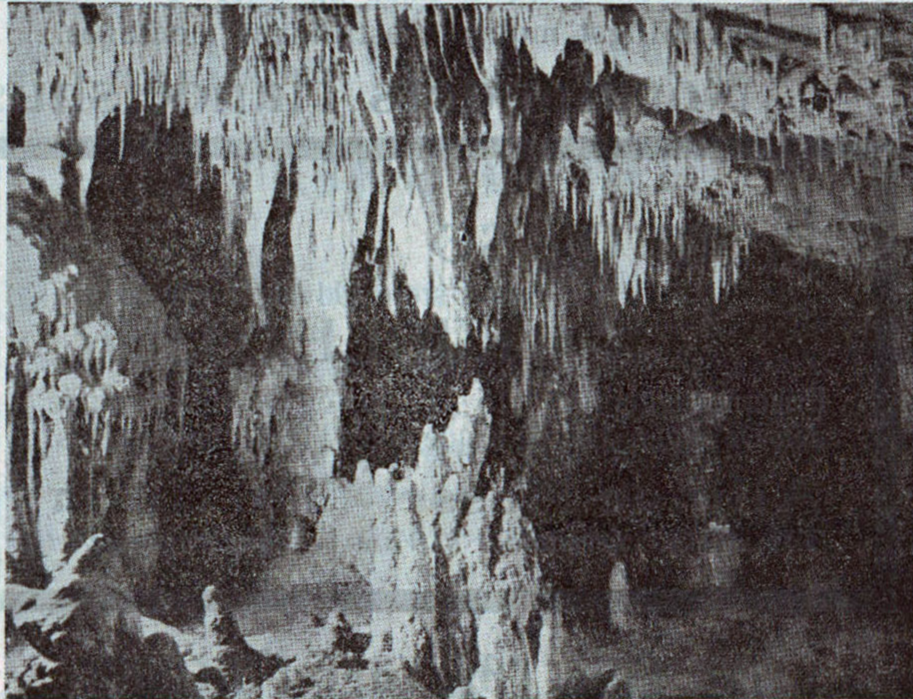
Drypstensdannelse i Adelsberggrotten.