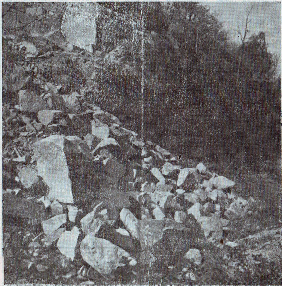
Granitbruddet i Støredal,

Hun stod bagved en meget smuk, ung Amerikaner, ud af hvis Ansigt Spilletets Vanvid dog lyste. Hans Pande var sammentrukket af dybe Rynker, hans Mund stod halvt aaben og hans Øjne, der i Øjeblikket var stirrende og anspændte, flakkede derefter uroligt omkring. Hans Ansigt var dødblegt. Hans Hænder rystedes af nervøse Trækninger og samlede Bunker af Sedler og Dynger af Guld sammen, der i et Nu atter spredtes og derefter igen kom tilbage, alt eftersom Heldet eller Uheldet fulgte ham.