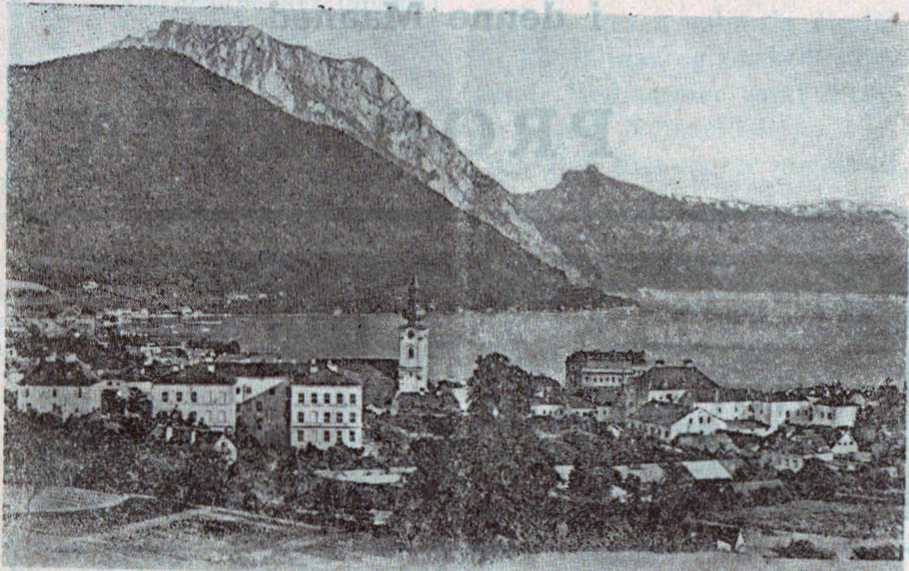
Gmunden med Traunsee.

Den alvorligere Del af Festen var forbi. Ungdommen samlede sig i Grupper udenfor den maleriske Kirke og skød deres Bøsser af. — Mens Solen gik ned bag snedækte Alpetoppe og glødede paa fjerne Højder, gled mørke Skygger frem gennem Dalen, og de tavse, alvorlige Fjelde indhylledes i Taagedis. I denne storladne Natur følte vi os som paa Evighedens Tærskel, og Kuldegys gennemrislede os. Vi søgte, ligesom de andre, Gæstgivergaarden, der var smykket med Flag og Blomster. Her var Dans og Tramp i Gulvet af sømbeslaaede Støvler. Unge Knøse med Fjer i Hatten svang barhovede eller med hvide Tørklæder prydede, buttede Ungmøer i en fejende Tirolerhopsa under Jodlen og Jauchzen. Livsglæden stod i underlig Modsætning til den storladne, alvorlige Natur.