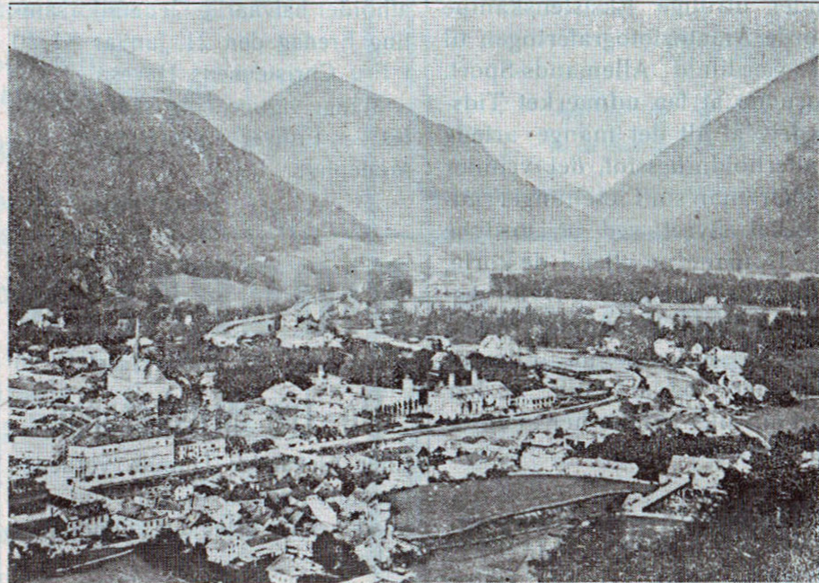
Ischl, Indgangen til Tødesgebirge og Salzkammergut.

Fra sagkyndig Side udtaltes bl. a. i »Jyllp.« i 1929: