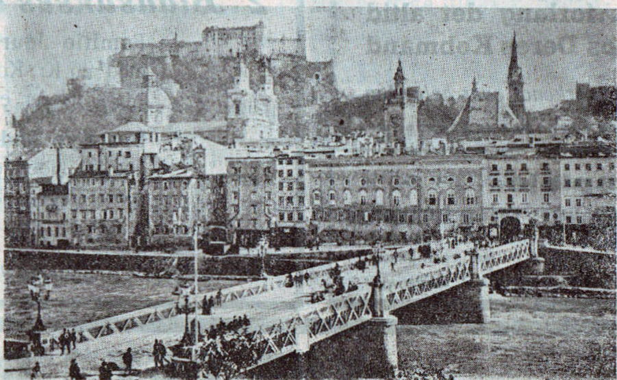
Salzburg med Hohe Feste.

Var tidligt oppe næste Morgen og fulgte Vejen ned gennem det 1200 m høje Pas, gennem skovklædte Dale, der udvider sig i en bredere Tværdal. Foran os skimter vi Hohe Salzburg og Byens mange Kirketaarn. Uendelig smuk ligger Byen i den brede Dal, flankeret af mægtige Bjergkæder, belyst af Formiddagssol. I Bjerget hugges dybe Tunneler, hvorfra de ældgamle Saltlejer udvindes, for dum Byens vigtigste Indtægtskilde. Nu er det vistnok Turisterne, der bringer de fleste Penge til Huse, overalt ser man dem, parvis eller i Flokke — Rygsæk paa Nakken, Alpestav i Haand. — Alverdens Nationer synes repræsenteret, alle har de Lyst og Mod, en forunderlig forvoven Hang til at bestige og udforske disse himmelstræ-