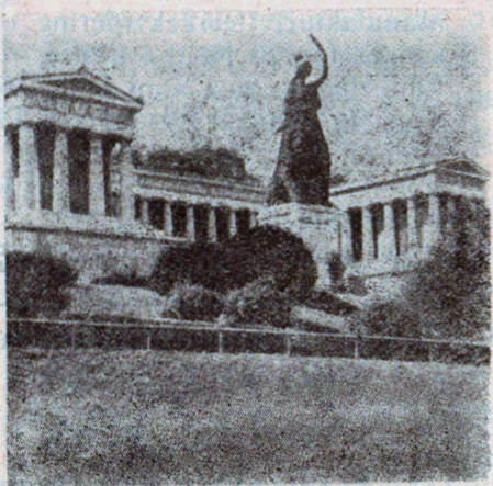
Rühmeshalle med Bavaria.

Ikke langt herfra ligger Hofteatret og det kongelige Slot; dog først Mønten — en af de ældste Bygninger, hvis firkantede Gaard omslutes af et gennem tre Etager løbende aabent Galleri. I det 14. Aarhundrede benyttedes denne Gaard som Arena for Tourneringer. I det gamle Slot findes en smuk gammel Broncestatue af Jomfru Maria med Barnet. Senere vil vi se, hvorledes disse to Helgenfigurer gennem Tiderne omformes, idet det lille Jesusbarn iklædes Munkekoften og optages i Byens Vaaben — den lille Munk. Jomfru Maria omformes til „Bavaria“, Sejersgudinden paa Siegesthor, der kører frem med et Firspar af Løver! — og hendes Kultus kulminerer i Kæmpestatuen