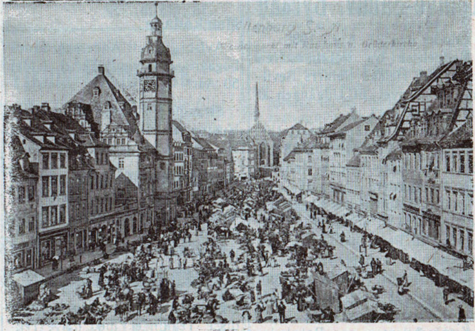
Torvet i Altenburg.