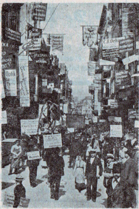
Petersstrasse under Messen.

Næste Dag aflagdes Besøg i flere store Virksomheder indenfor vort Fag, men vi var ikke saa heldige at finde Beskæftigelse. — Var paa Kunstmuseet paa Augustusplads og saa bl. a. „Lader de smaa Børn komme til mig“, David med Slingen og Københavns Raadhus.