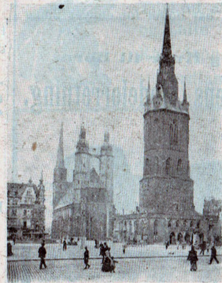
Markedsplads i Halle.

Vi fulgtes ad, Studenten og jeg, og om Eftermiddagen dukkede allerede Halles Taarne og Spir frem i Horisonten. Gennem Forstaden naaede vi ind til den gamle By, hvis Volde og Grave danner idylliske Parkanlæg med antikke massive Stenbænke under ældgamle Træer, en Idyl, der mindede mig om, at jeg havde set noget lignende i — Besancon! Ogsaa der fandtes græsklædte Voldgrave og middelalderlige Stenbænke.