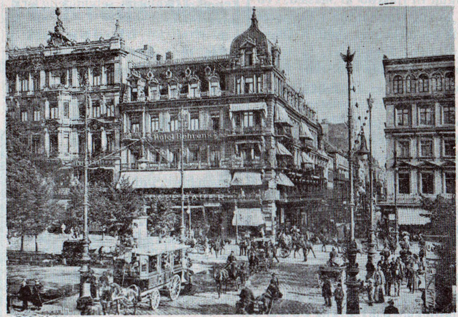
Unter den Linden, Berlin.