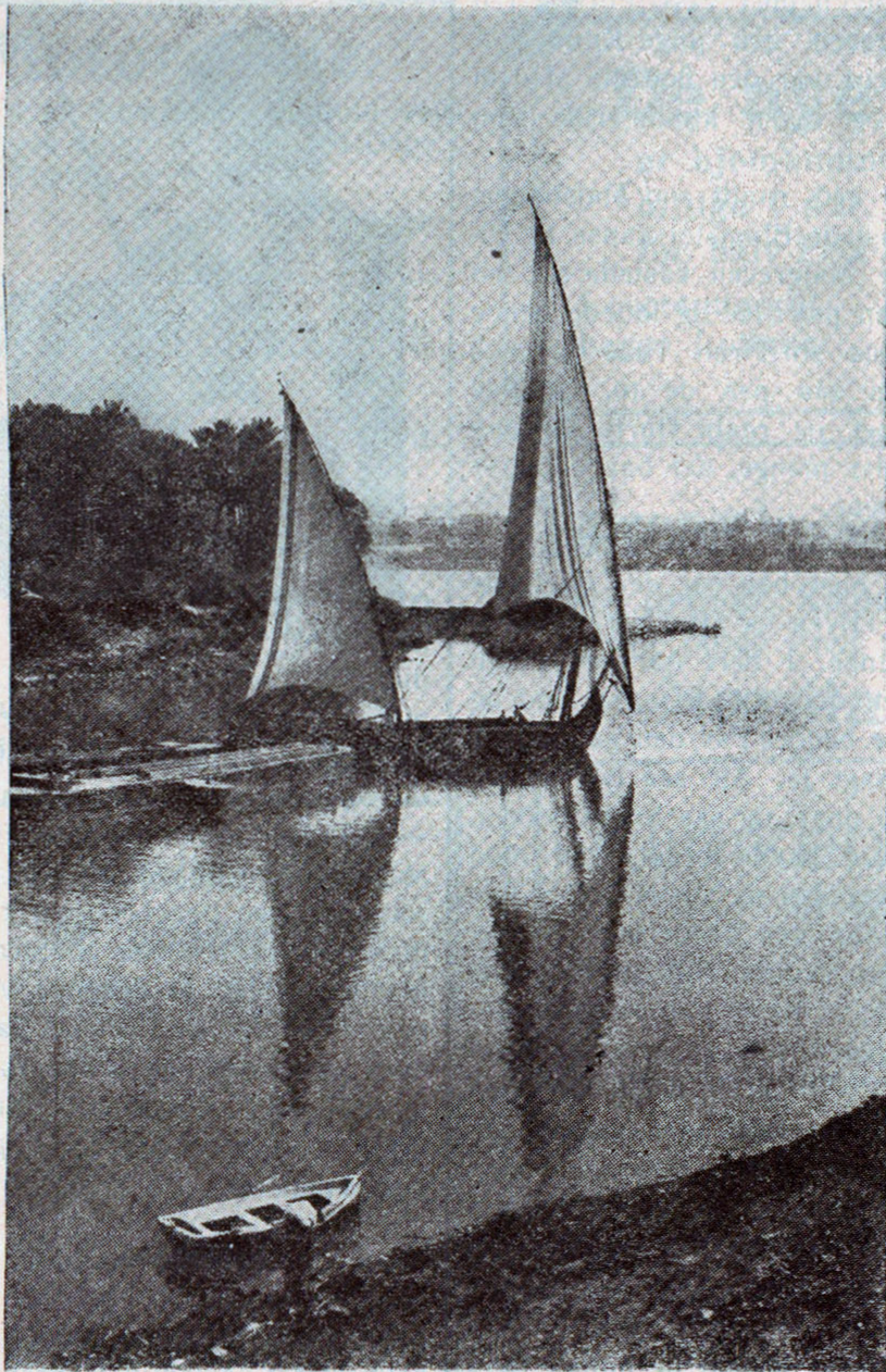
Aftenstemning ved Suez.

Grublende gik jeg ind i Cafe Franz, der sædvanligt besøges af et tvivlsomt Publikum. Jeg satte mig i en Vinduesnische og be-