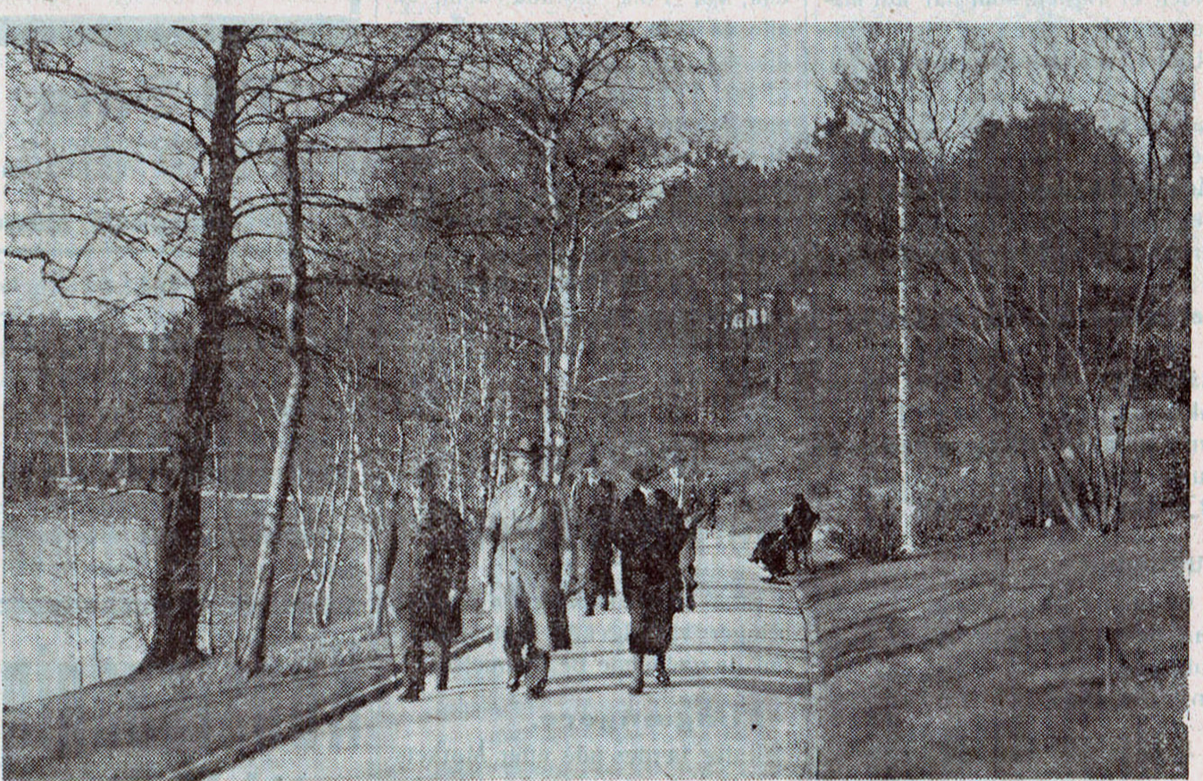
- og nu er det Foraar i Danmark

Holm nikkede kun. Saa gik han ned til Stranden og lod Djunken gøre klar. Med nogle Indfødte gik han ombord i det smalle Fartøj og sejlede bort.