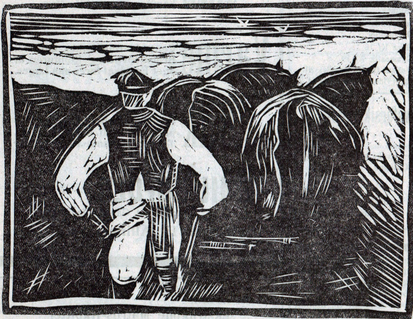
Linoleumssnit af Carl Bernhard Svendsen