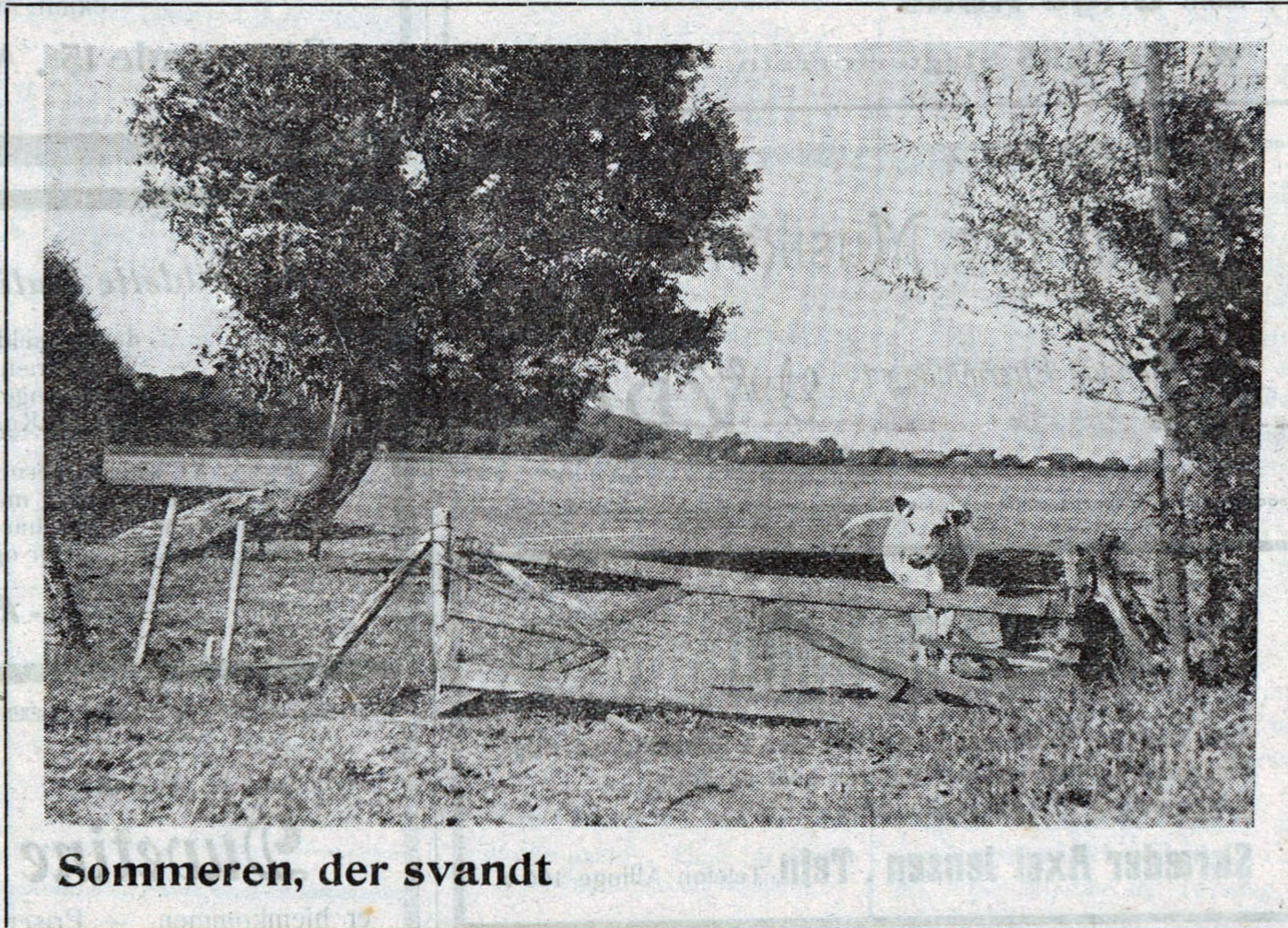
Sommeren, der svandt

Det kan ikke forbavse, at man i hine Tider, hvor man virkelig troede at et Menneske kunde blive blind af frisk Luft, kunde faa Kolera af at bade og Pest, hvis man gik ad rensede Gader, var man ogsaa bange for den nyopdagede Jernbanes uhyre Hurtighed — den skød jo en Fart af 30—40 km i Timen. — Man forsøgte virkelig somme Steder at faa sat en Stopper for det trafikale Uvæsen ved at give „videnskabelige“ Grunde for dets Skadelighed. — Men den nye Tid brød sig Vej trods alt Bagstræb.